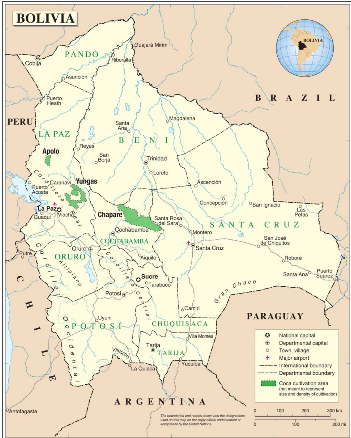
This map has been adapted by the International Crisis Group from Map No. 3875 Rev. 3 (August 2004) by the Cartographic Section of the United Nations Department of Peacekeeping Operations. The coca cultivation areas and region names have been added.